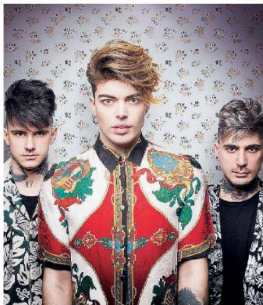
Il concerto. I The Kolors che si esibiranno in occasione del Cous Cous Fest