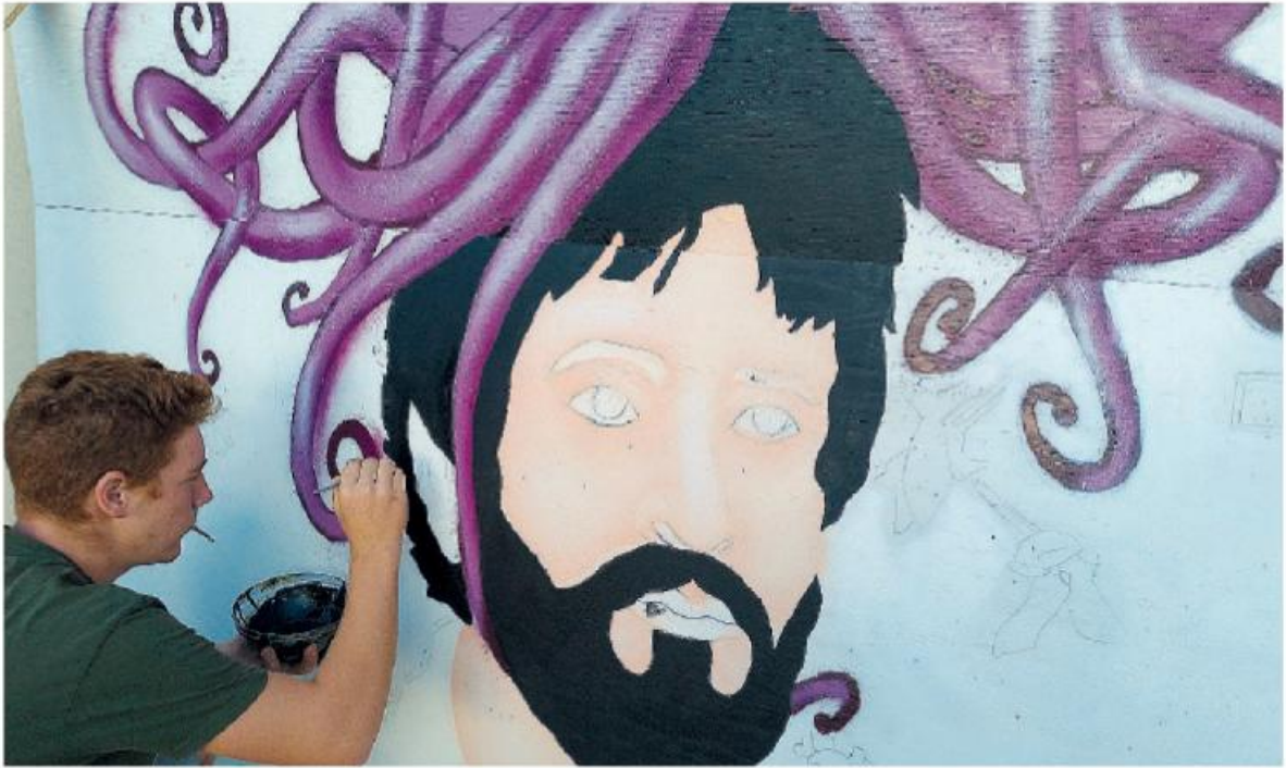
L'opera d'arte. Il volto di Mauro Rostagno su un muro a Trapani